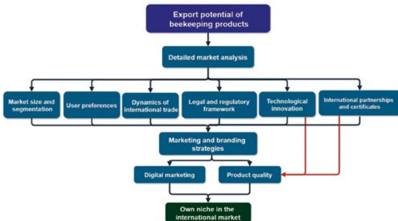
CHART 1. THE RELATIONSHIP BETWEEN MARKET ANALYSIS AND MARKETING AND BRANDING STRATEGIES